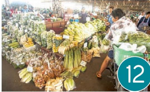
ออแกนิกมาร์เก็ต ดาวรุ่งพุ่งแรง สวนการเมืองพิษพาราควอต